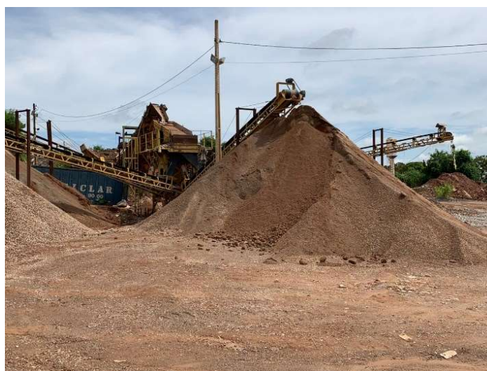
Figura 1 - Usina de reciclagem de resíduos da construção civil (Aparecida de Goiânia-GO).

Os agregados naturais, tanto grúdo como miúdo natural, foram obtidos na cidade de Goianésia-GO em loja de materiais de construção. O agregado reciclado foi obtido por meio de Resíduos da Construção Civil, enquadrados na classe A da Resolução N° 307 do CONAMA (2002), fornecidos por uma usina responsável por este tipo de material reciclado, da cidade de Aparecida de Goiânia-GO, conforme Figura 1.