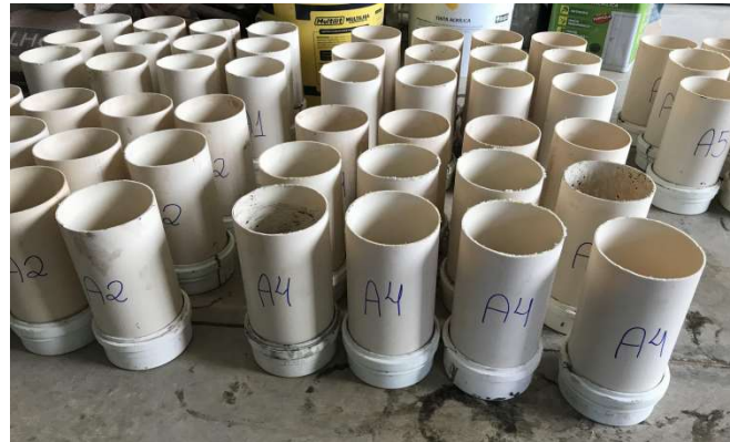
Figura2 – Confeção dos corpos de provas.