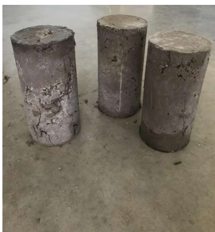
Figura 5 - Corpo de prova após rompimento.

Através das realizações dos ensaios de rompimento dos corpos de provas foi possível analisar as resistências à compressão simples adquiridas. Por meio da Figura 5 é possível verificar os corpos de provas pós rompimento.