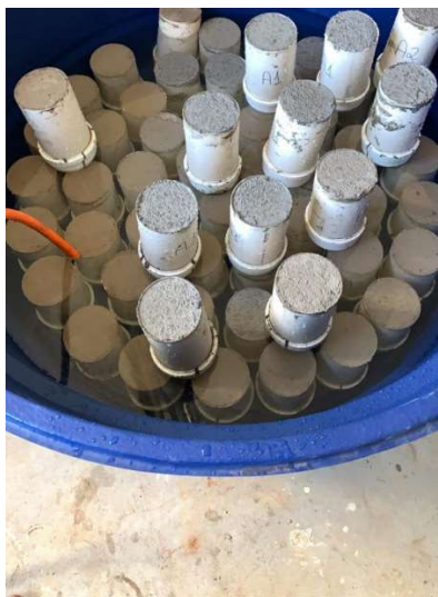
Figura 4 – Processo de submersão dos corpos de prova.

Depois de decorrido 24 horas, os mesmos foram submersos em câmara úmida, armazenados em uma caixa d'água (Figura 4) para iniciar o processo de cura.