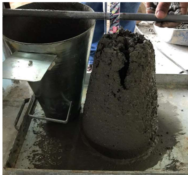
Figura 3 – Ensaio de abatimento do tronco de cone.

O ensaio de abatimento do tronco de cone, foi realizado por meio da medição direta do deslocamento vertical do topo do cone de concreto após a retirada do molde, conforme NBRNM 67 (ABNT, 1998). O concreto apresentou um abatimento de 3 cm. A Figura 3 apresenta a execução do SlumpTest .