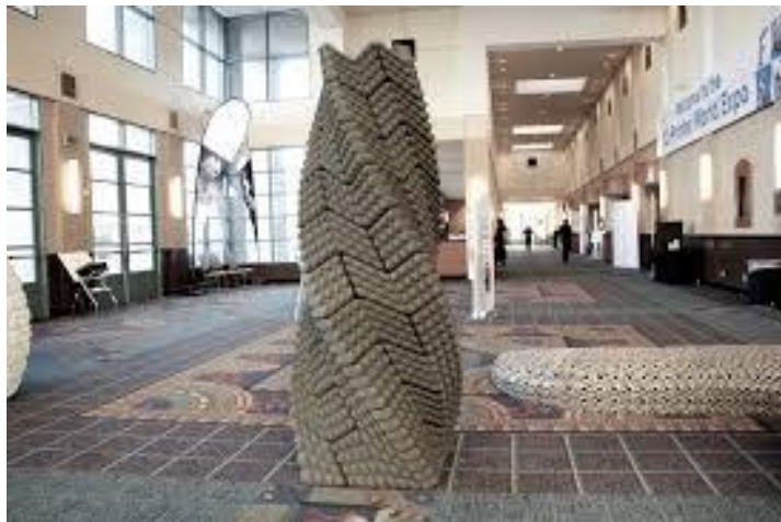
Figura 2: http://www.emergingobjects.com/project/quake-column/

Outra iniciativa é Quake Column, construção de colunas inspiradas nas técnicas Incas, constituída por blocos ocós empilháveis sem a utilização de argamassa para unir os blocos, que resulta em uma estrutura torcionaria e oscilável, com uma elevada resistência a ação sísmicas, que pode ser observada na Figura 2.