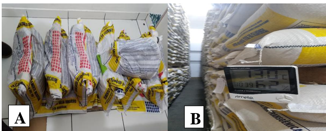
FIGURA 1 - Sementes em sacas, sobre compensado revestido com lona, em ambiente convencional (A); Sementes beneficiadas e mantidas na sementeira (Brejeiro) em ambiente de armazenagem controlado (B); Anápolis-GO, 2018.

As sementes estavam condicionadas em ambiente controlado e ambiente convencional (que foram salvas por produtores na última safra 2017/2018), onde foram avaliados os dois segmentos para parâmetros de comparação de qualidade de uma para outra. A primeira, chamada de condição B1: condicionadas em sacas, sobre compensado revestido com lona, em ambiente convencional, em um cômodo com parede de alvenaria e cobertura em laje, há temperatura ambiente, a segunda intitulada de condição B2: sementes beneficiadas e mantidas na sementeira (Brejeiro) em ambiente de armazenagem controlado a temperatura variando de 12°C a 15°C (Figura 1).