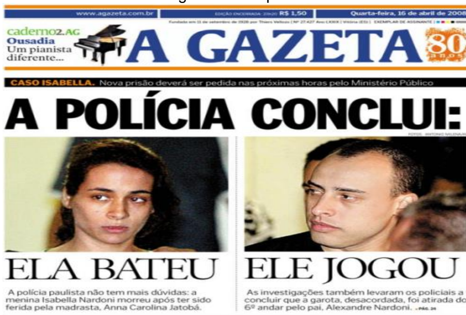
Figura 03 - Capa do Jornal A Gazeta