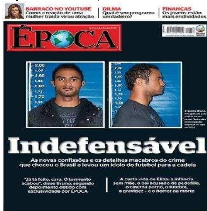
Figura 14 - Revista Época sobre o Caso Bruno