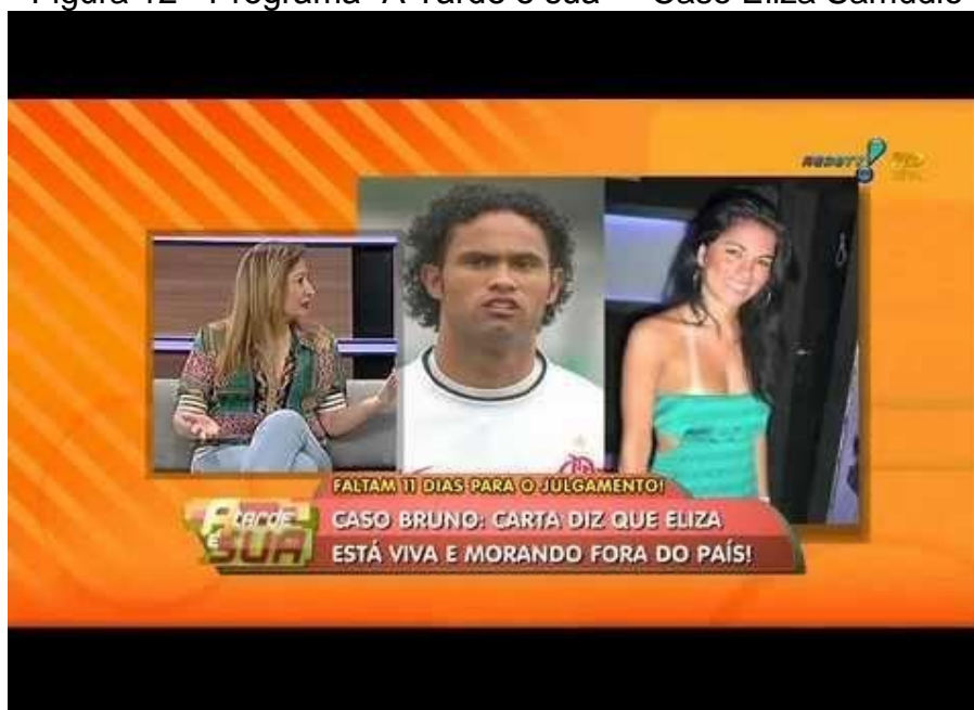
Figura 12 - Programa “A Tarde é sua” – Caso Eliza Samúdio

A morte da vítima Eliza Samúdio sempre foi muito debatida nos primeiros anos do crime, com várias alegações de que a mesma estaria viva, como nota-se na Figura 12, causando sentimentos contrários da sociedade, que em sua maioria condenavam o goleiro e os participantes do crime, mas a cada notícia tinham um posicionamento contrário, retraído sobre a autoria criminal.