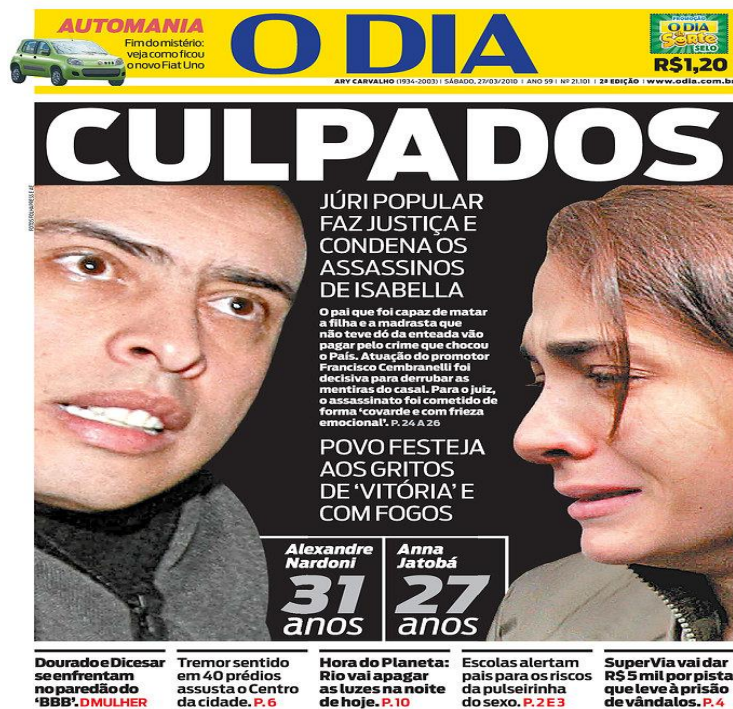
Figura 05 - Capa do Jornal “O Dia”

bastante comemorado ao final do processo, com a condenação dos acusados, como mostra a Figura 05.