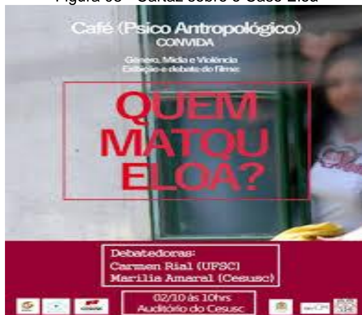
Figura 08 - Cartaz sobre o Caso Eloá