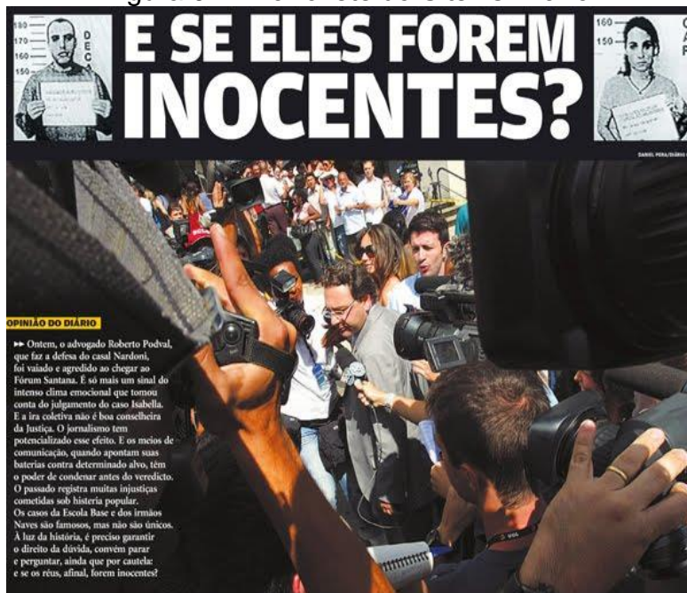
Figura 04 - Manchete do Site “O Diário”

Observa-se em comparação a Figura 04 a seguir: