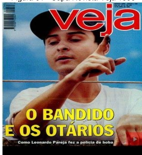
Figura 01 - Capa Revista Veja 1996

Poucos criminosos tiveram tanta influência midiática e ganharam atenção popular como o bandido goiano, fazendo uso de diversos meios de comunicação para se expressar para a sociedade e também para confundir a polícia a respeito de suas práticas criminosas. Veja-se a Figura 01, da Revista Veja: