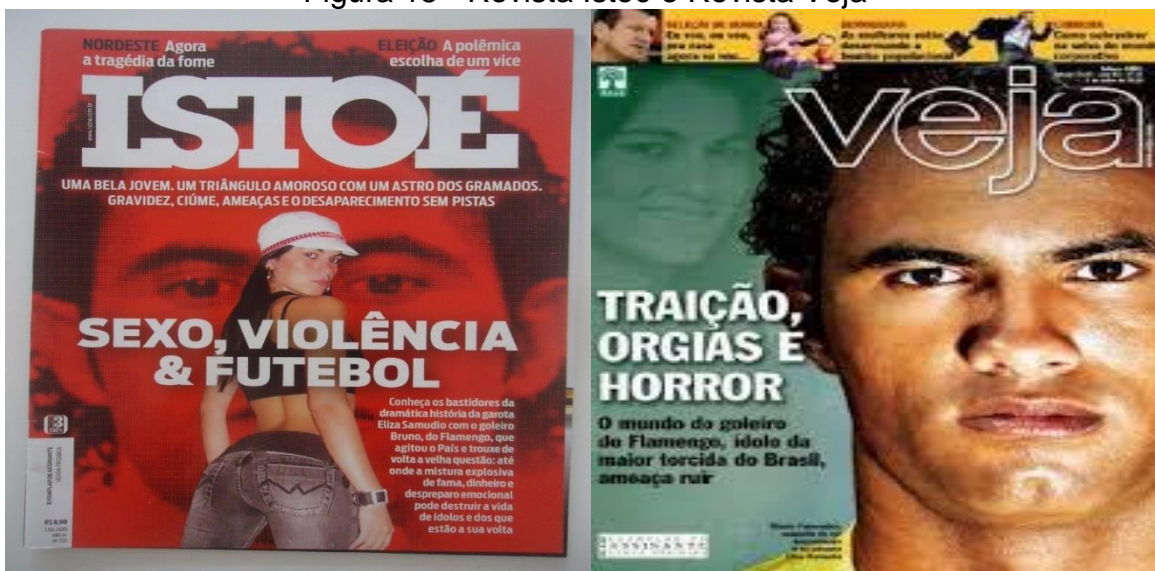
Figura 15 - Revista Istoé e Revista Veja