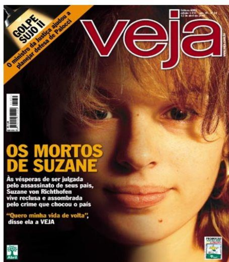
Figura 10 - Capa da Revista Veja em 2006

Caso de semelhante repercussão, que chama atenção popular até os dias atuais foi o caso Suzane Richthofen, a jovem que levou a óbito os próprios pais, como ilustrado na Figura 09 da monografia, reportada pela Revista Veja, trazendo posicionamentos sobre o crime que foi cometido na época.