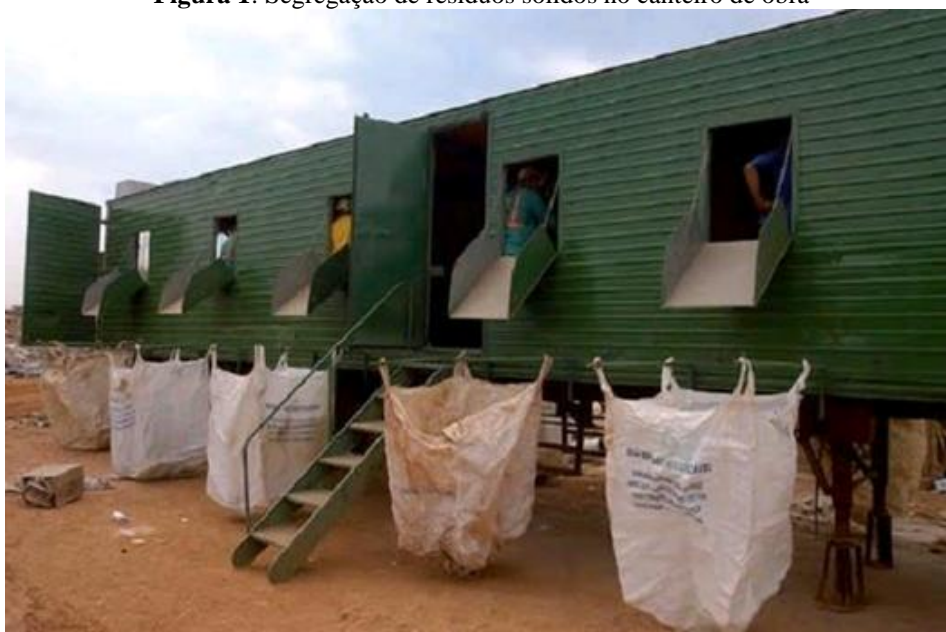
Figura 1: Segregação de resíduos sólidos no canteiro de obra

1º etapa: Segregação ou triagem é bem relevante para o processo de gerenciamento dos resíduos da construção e demolição (RCD), pois, se bem executada, possibilitará a máxima reciclagem dos resíduos, considerando que estes sejam encaminhados para usinas de reciclagem. (Figura 1). Para que os resíduos sejam reciclados e reaproveitados como matéria-prima, as características do produto reciclado devem ser compatíveis ao uso a que ele se propõe Silva et al (2016) consideram que, para realizar a segregação de RCD nos canteiros de obras, pode-se utilizar a mão de obra que deve ser previamente treinada. Além da triagem auxiliar à reciclagem dos resíduos, também pode contribuir para a organização e limpeza do canteiro, beneficiando na redução de acidentes de trabalho causados pela desordem dos canteiros de obras.