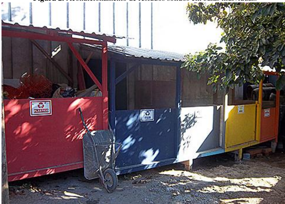
Figura 2. Acondicionamento de resíduos sólidos em baias individuais