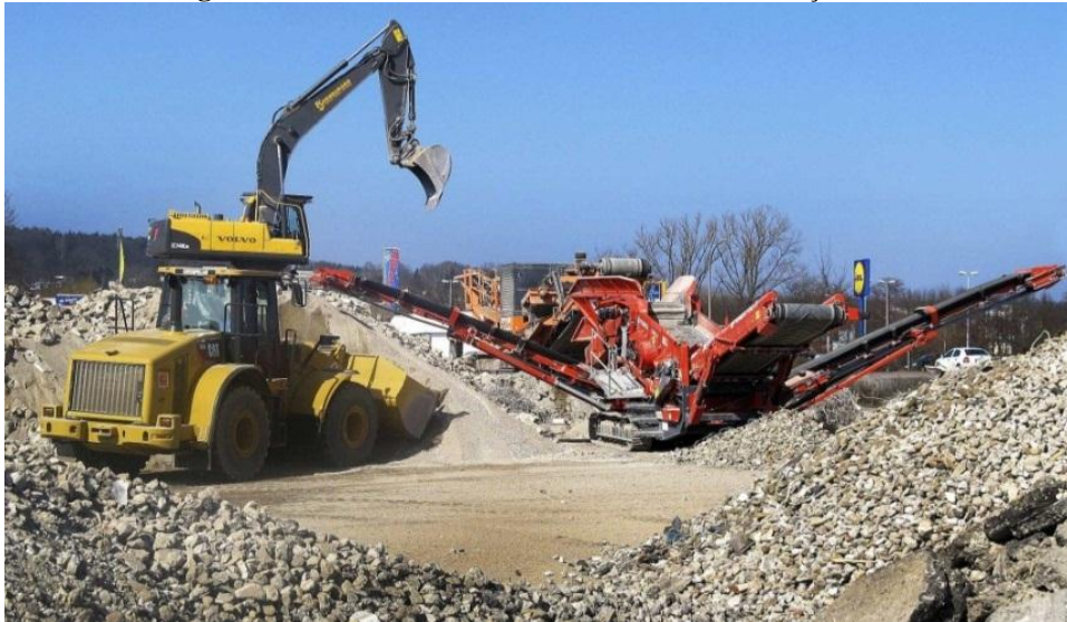
Figura 4. Tratamento dos resíduos sólidos da construção civil