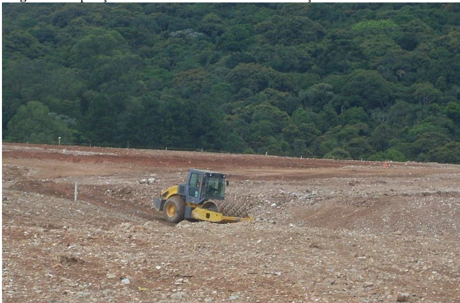
Figura 5. Disposição final de resíduos sólidos da construção civil em aterro de inertes

5ª etapa: A disposição final adequada de resíduos sólidos urbanos (RSU) registrou um índice de 59,1% do montante anual encaminhado para aterros sanitários. (Figura 5). As unidades inadequadas como lixões e aterros controlados, porém, ainda estão presentes em todas as regiões do país e receberam mais de 80 mil toneladas de resíduos por dia, com um índice superior a 40%, com elevado potencial de poluição ambiental e impactos negativos à saúde. A disposição final dos resíduos sólidos da construção civil no Brasil se dá através dos aterros sanitários, aterros controlados e lixões, sendo que os volumes dispostos nos mesmos no ano de 2017 representam respectivamente 59,1%, 22,9% e 18% ABRELPE (2017). Ainda é importante ressaltar que o único material a ser destinado em aterros sanitários são os rejeitos, materiais esses sem potencial de reuso ou reciclagem, para os demais rejeitos se devem buscar meios para reutilização (Spinola, 2017).