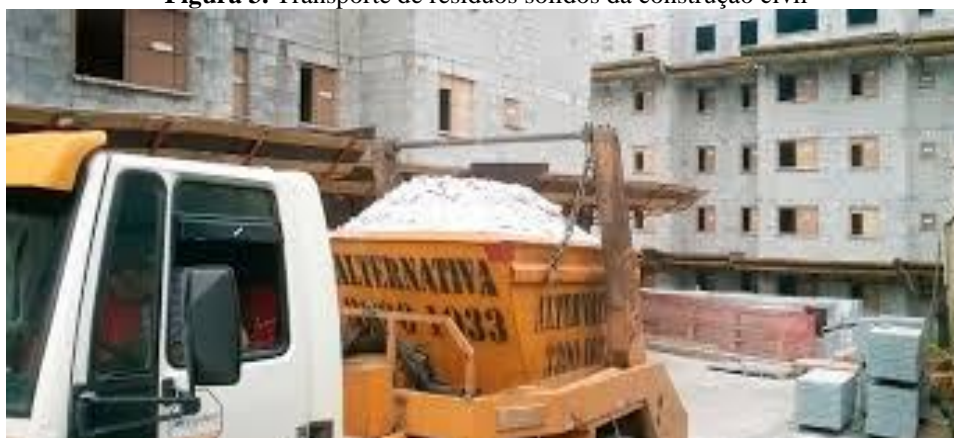
Figura 3. Transporte de resíduos sólidos da construção civil

A falta de grandes áreas que atendam a necessidade de construção de um aterro sanitário faz com que a distância percorrida para disposição final dos resíduos sólidos aumente com o passar dos anos, implicando em uma elevação dos custos de operação do sistema de limpeza urbana associados ao transporte e à necessidade de construção de estações de transferência, Castro, Silva, Marchand (2015). A ABRELPE em seu panorama nacional, referente ao ano de 2017, em conformidade com essa informação ao comparar que no ano de 2016 o percentual de resíduos sólidos urbanos (RSU) encaminhados aos aterros sanitários era de 59%, com aproximadamente 114.189 ton./dia, enquanto que no ano de 2017 houve um aumento nessa disposição final para 59,1%, com total registrado de 115.801 ton./dia (ABRELPE, 2017).