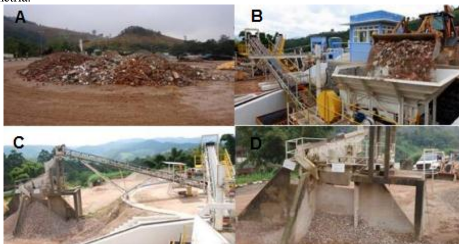
Figura 6. Etapas de uma usina de reciclagem de entulhos. A – depósito de resíduos para triagem; B – equipamento de moagem; C – britador de mandíbula e D – agregados já reciclados classificados de acordo com sua granulometria.

Nas usinas brasileiras as principais etapas de operação observadas são ABRECON (2017, p. 108): recebimento; triagem primária; despejo dos resíduos de construção e demolição (RCD) no alimentador vibratório; britagem dos resíduos; separação magnética (ou por densidade) de metais possivelmente presentes; triagem secundária (por catação); peneiramento e classificação do material; estocagem segregada dos produtos finais para a venda. É apresentada por Silva e Paschoalin Filho (2018) a sequência de operação de uma Usina de Reciclagem de Entulhos – URE: (Figura 6).